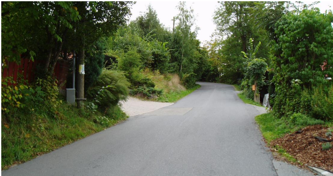
Foto: Landøyveien sett mot syd, fartsmåler på stolpen til venstre i bildet.

Høyeste hastighet, 82 km/t, ble registrert torsdag kl. 1627 i retning fra nord. Andre høye hastigheter fremgår av vedleggene.